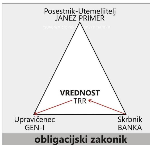
Slika: Prenos VREDNOSTI v dvostranskem pravnem poslu