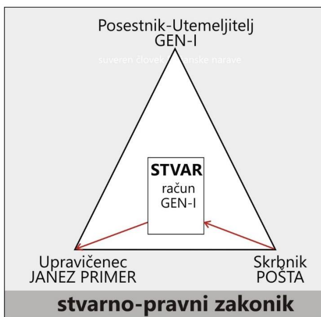
Slika: Prenos STVARI v dvostranskem pravnem poslu

Po pogodbi med trgovskima strankama GEN-I in JANEZ PRIMER je: