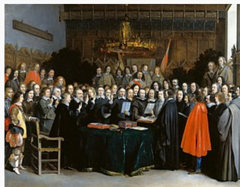
Gerard ter Borch (1648): Ratifikacija Sporazuma v Münstru, 15. maj 1648